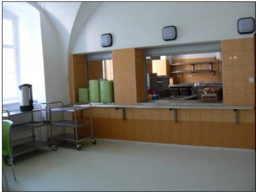
PŘEDOKENNÍ ROLETY R1 ilustrační obrázky

VÝKRES NESLOUŽÍ JAKO VÝROBNÍ DOKUMENTACE. PŘED VÝROBOU JE NUTNÉ VŠECHNY MÍRY NA STAVBĚ OVĚŘIT.