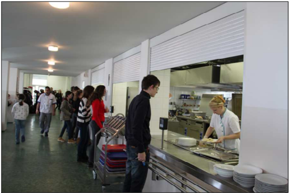
D1 - MADLO